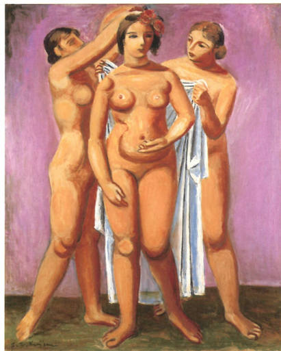
《独立美術首途(第二の誕生)》1931年 横須賀美術館蔵