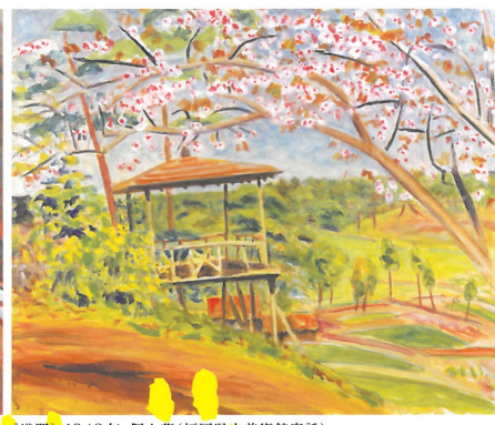
《満開》1948年 個人蔵(福岡県立美術館寄託)