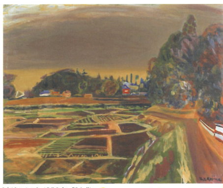
《春遠からじ》1950年 個人蔵

日時：10月7日(土)、10月21日(土)、12月9日(土) 会場：福岡県立美術館4階展示室内 参加無料(要観覧券) / 予約不要