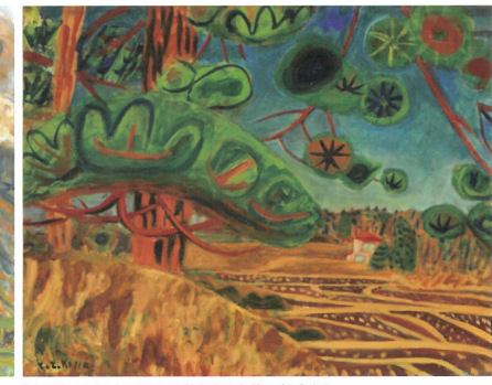
《東風》1939年 個人蔵(福岡県立美術館寄託)