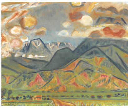
《アルプスへの道》1951年 東京国立近代美術館蔵