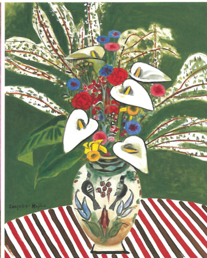
《雪柳と海芋に波斯の壺》1956年 東京国立近代美術館蔵