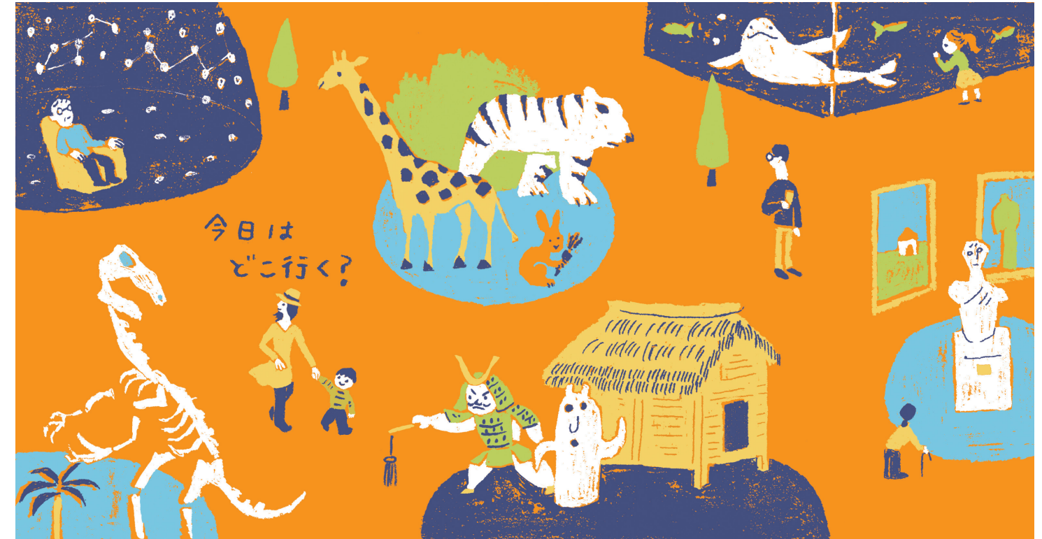
表紙イラスト／後藤ガリ版印刷所

福岡市中央区天神5-2-1 (福岡県立美術館内) tel.092-715-3551