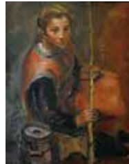
中村研一「魚つり」1926年、個人蔵 (中村研一・琢二生家美術館寄託)

宗像出身の中村研一(1895-1967)と中村琢二(1897-1988)は、ともに日本の近代洋画を代表する画家兄弟です。本展では、近年発見された中村研一の滞欧期の初公開作品3点を中心にしながら、県内に伝わる優れた個人コレクションも交えて、研一と琢二の作風の違いや魅力に迫ります。