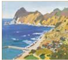
中村琢二「波勝崎」1973年、当館蔵