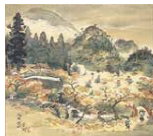
富田溪仙「梅尾晩秋」1934年、当館蔵