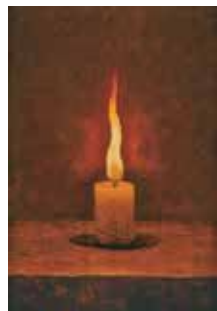
高島野十郎「蠟燭」大正期、当館蔵