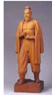
山崎朝雲「力角之宿禰」 1926年、当館蔵