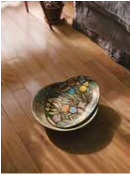
鹿児島陸 大皿と大鉢 2023年

本展は、陶芸作品を中心に、テキスタイル、版画など多彩な仕事で注目を集める鹿児島陸が地元福岡で開催する初の大規模な展覧会です。色とりどりの器や様々なプロダクトを日々の暮らしのシチュエーションで紹介していきます。鹿児島陸が日々思う、わたしたちの「まいにち」を感じる、しあわせな時間をお楽しみください。