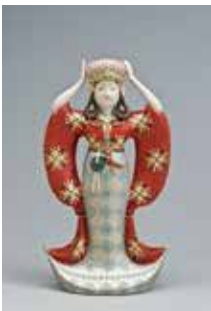
鹿児島陸蔵「紙塑人形「卑弥呼」」 1966年、当館蔵