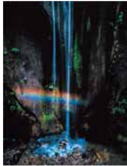
大脇洋彦「夏の滝」(第78回 写真部門福岡県知事賞受賞作品)