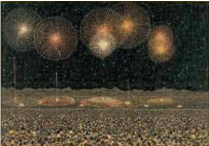
山下清「長岡の花火」1950年 貼絵 © Kiyoshi Yamashita/STEPEast2024

山下清は放浪の天才画家として知られており、懐かしい日本の原風景や名所を貼絵で表し、多くの人々の心を捉えました。生誕100年を記念する本展では、代表的な貼絵の作品に加えて、子供時代の鉛筆画や後年の油彩、陶磁器、ペン画などを展示し、山下清の生涯と画業を紹介します。